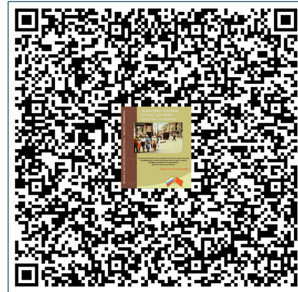
QR-код сборника Второй конференции «Любимый Харбин – город дружбы России и Китая»

По окончании Второй конференции «Любимый Харбин» по инициативе её участников был создан Клуб «Любимый Харбин», первая встреча которого прошла 11 октября 2021 года. За весь период работы Клуба ЛХ прошло 23 встречи. Обработанные записи (с указанием тематики встреч) открыты на YouTube.